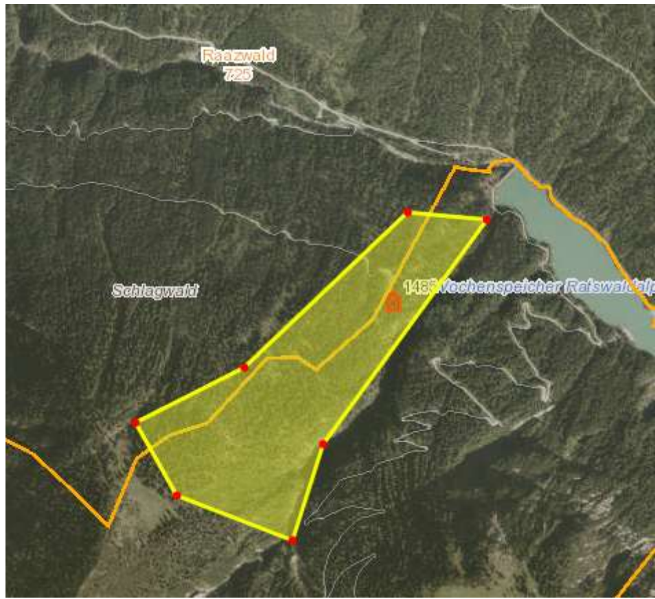
Darstellung der Wildruhefläche „Kobel“: